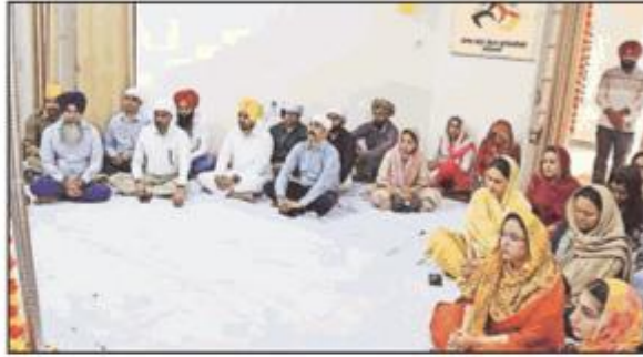
ਗੁਰਬਾਣੀ ਕੀਰਤਨ ਸੁਣਦੇ ਯੂਨੀਵਰਸਿਟੀ ਦੇ ਵਾਈਸ ਚਾਂਸਲਰ ਅਤੇ ਅਧਿਆਪਕ। (ਲੰਦਰ)

ਯੂਨੀਵਰਸਿਟੀ ਦੇ ਪ੍ਰਬੰਧਕੀ ਬਲਾਕ ਵਿਚ ਸ੍ਰੀ ਅਖੰਡ ਪਾਠ ਸਾਹਿਬ ਨਾਲ ਆਰੰਭ ਕਰਵਾਏ ਗਏ ਸਨ, ਜਿਨ੍ਹਾਂ ਦੇ ਡੌਗ ਉਪਰੰਤ ਕੀਰਤਨ ਨਾਲ ਸਮਾਪਤ ਹੋਇਆ। ਯੂਨੀਵਰਸਿਟੀ ਦੇ ਵਾਈਸ ਚਾਂਸਲਰ ਪ੍ਰੋ.