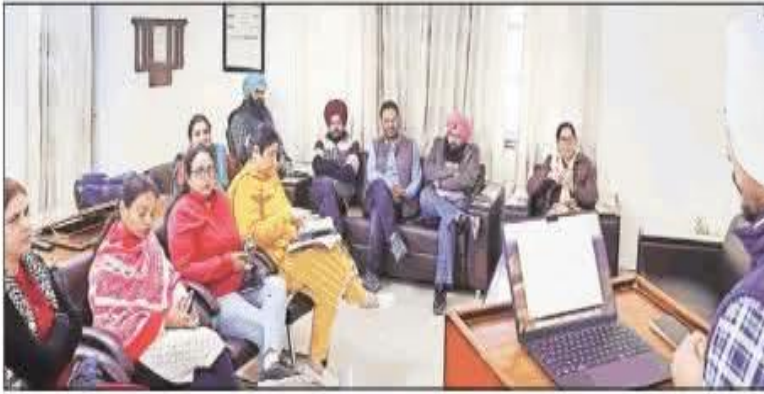
यूनिवर्सिटी में आयोजित फेकल्टी इंडक्शन प्रोग्राम का दृश्य।