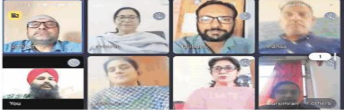
ਓਪਨ ਯੂਨੀਵਰਸਿਟੀ ਵੱਲੋਂ ਆਯੋਜਿਤ ਪ੍ਰੋਗਰਾਮ ਦਾ ਦ੍ਰਿਸ਼।