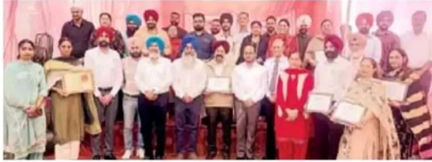
श्री गुरु तेग बहादुर की जयंती के अवसर पर जानकारी देते सदस्य।