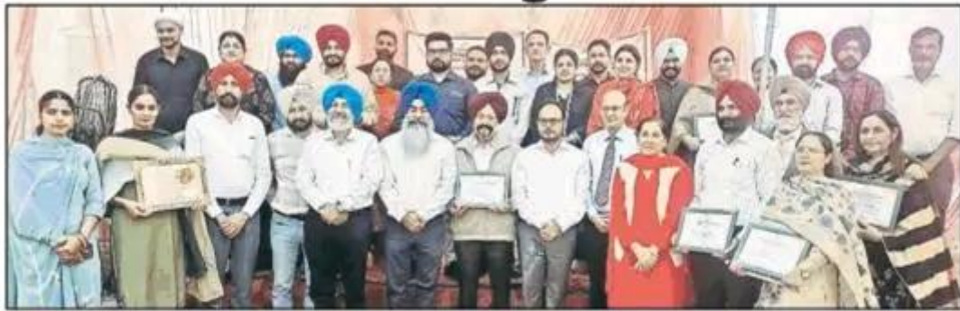
ਸੈਮੀਨਾਰ ਦੌਰਾਨ ਲਰਨਰ ਸਪੋਰਟ ਸੈਂਟਰਾਂ ਦੇ ਅਹੁਦੇਦਾਰਾਂ ਨੂੰ ਸਨਮਾਨਿਤ ਕੀਤੇ ਜਾਣ ਦਾ ਦ੍ਰਿਸ਼।