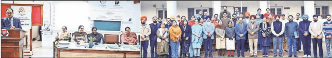
ਓਪਨ ਯੂਨੀਵਰਸਿਟੀ ਵਲੋਂ ਆਯੋਜਿਤ ਪ੍ਰੋਗਰਾਮ ਦਾ ਦ੍ਰਿਸ਼ ਅਤੇ ਮੌਜੂਦ ਕਾਲਜਾਂ ਦੇ ਨੁਮਾਇੰਦੇ।