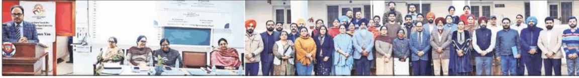
ओपन यूनिवर्सिटी द्वारा आयोजित कार्यक्रम का दृश्य तथा कार्यक्रम के बाद विभिन्न कॉलेजों के प्रतिनिधि।