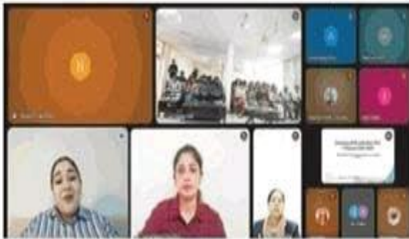
ਓਪਨ ਯੂਨੀਵਰਸਿਟੀ ਵੱਲੋਂ ਆਯੋਜਿਤ ਸੈਮੀਨਾਰ ਦਾ ਦ੍ਰਿਸ਼। (ਸ਼ੰਦਰ)

ਪਟਿਆਲਾ, 24 ਫਰਵਰੀ (ਰਾਜੇਸ਼ ਪੰਜੌਲਾ)- ਅੰਗਰੇਜ਼ੀ ਵਿਭਾਗ, ਜਗਤ ਗੁਰੂ ਨਾਨਕ ਦੇਵ ਪੰਜਾਬ ਸਟੇਟ ਓਪਨ ਯੂਨੀਵਰਸਿਟੀ ਵਿਖੇ ਪ੍ਰੋ. (ਡਾ.) ਰਤਨ ਸਿੰਘ ਵਾਈਸ-