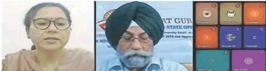
ਓਪਨ ਯੂਨੀਵਰਸਿਟੀ ਵਲੋਂ ਆਯੋਜਿਤ ਮਾਸਟਰ ਕਲਾਸ ਦਾ ਦ੍ਰਿਸ਼। (ਸੁੰਦਰ)

ਮਾਸਟਰਕਲਾਸ ਦੌਰਾਨ ਕਵਿਤਾ ਦੇ ਮੁੱਢਲੇ ਤੱਤਾਂ ਜਿਵੇਂ ਕਿ ਚਿੱਤਰਕਾਰੀ, ਲਹਿ, ਅਲੰਕਾਰਿਕ ਭਾਸ਼ਾ ਅਤੇ ਰਚਨਾ 'ਤੇ ਖਾਸ ਧਿਆਨ ਦਿੱਤਾ ਗਿਆ। ਇਸ ਤੋਂ ਇਲਾਵਾ ਮੁਕਤ ਛੰਦ, ਸੋਨਟ ਵਰਗੀਆਂ ਕਵਿਤਾ ਦੀਆਂ ਵੱਖ-ਵੱਖ ਸ਼ੈਲੀਆਂ ਬਾਰੇ ਵੀ ਜਾਣਕਾਰੀ ਦਿੱਤੀ ਗਈ।