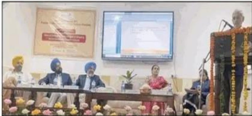
ਓਪਨ ਯੂਨੀਵਰਸਿਟੀ ਵੱਲੋਂ ਆਯੋਜਿਤ ਰਾਸ਼ਟਰੀ ਸੈਮੀਨਾਰ ਦਾ ਦ੍ਰਿਸ਼।