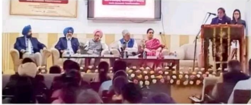
सैमीनार में मौजूद मेहमान व आयोजक।