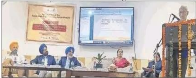
ओपन यूनिवर्सिटी द्वारा आयोजित राष्ट्रीय सैमीनार का दृश्य।